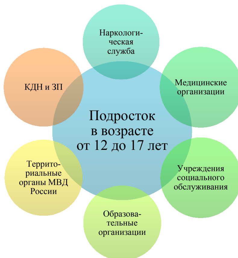
Рисунок 2. Межведомственное взаимодействие в сфере профилактики употребления ПАВ среди подростков

В соответствии с Федеральным законом от 24.06.1999 N 120-ФЗ (ред. от 03.07.2016) "Об основах системы профилактики безнадзорности и правонарушений несовершеннолетних" (с изм. и доп., вступ. в силу с 01.01.2017) выстраивается первичная профилактическая работа в среде подростков 12-17 лет.