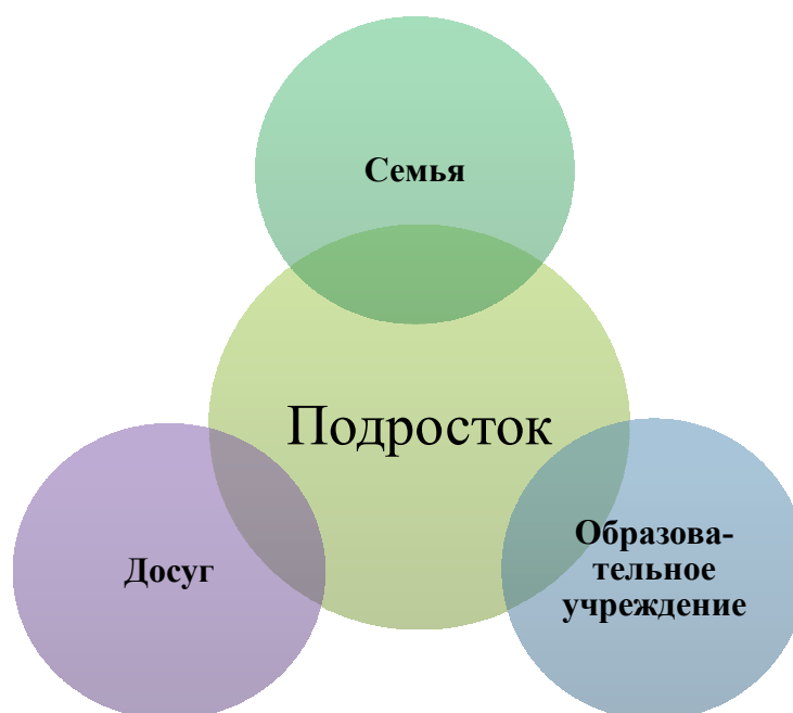
Рисунок 1. Современная концепция профилактики употребления ПАВ среди подростков

2. Формирование ресурсов семьи, помогающих воспитанию у подростков законопослушного, успешного и ответственного поведения, а также ресурсов семьи, обеспечивающих поддержку ребенку, начавшему употреблять наркотики, сдерживающих его разрыв с семьей и помогающих ему на стадии социально - медицинской реабилитации при прекращении приема наркотиков;